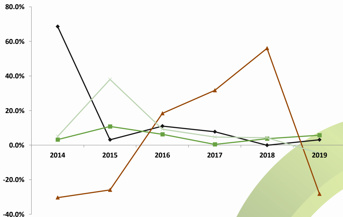
Рис. 3. Объем российского рынка сои и соевой продукции по сегментам, 2019г., %