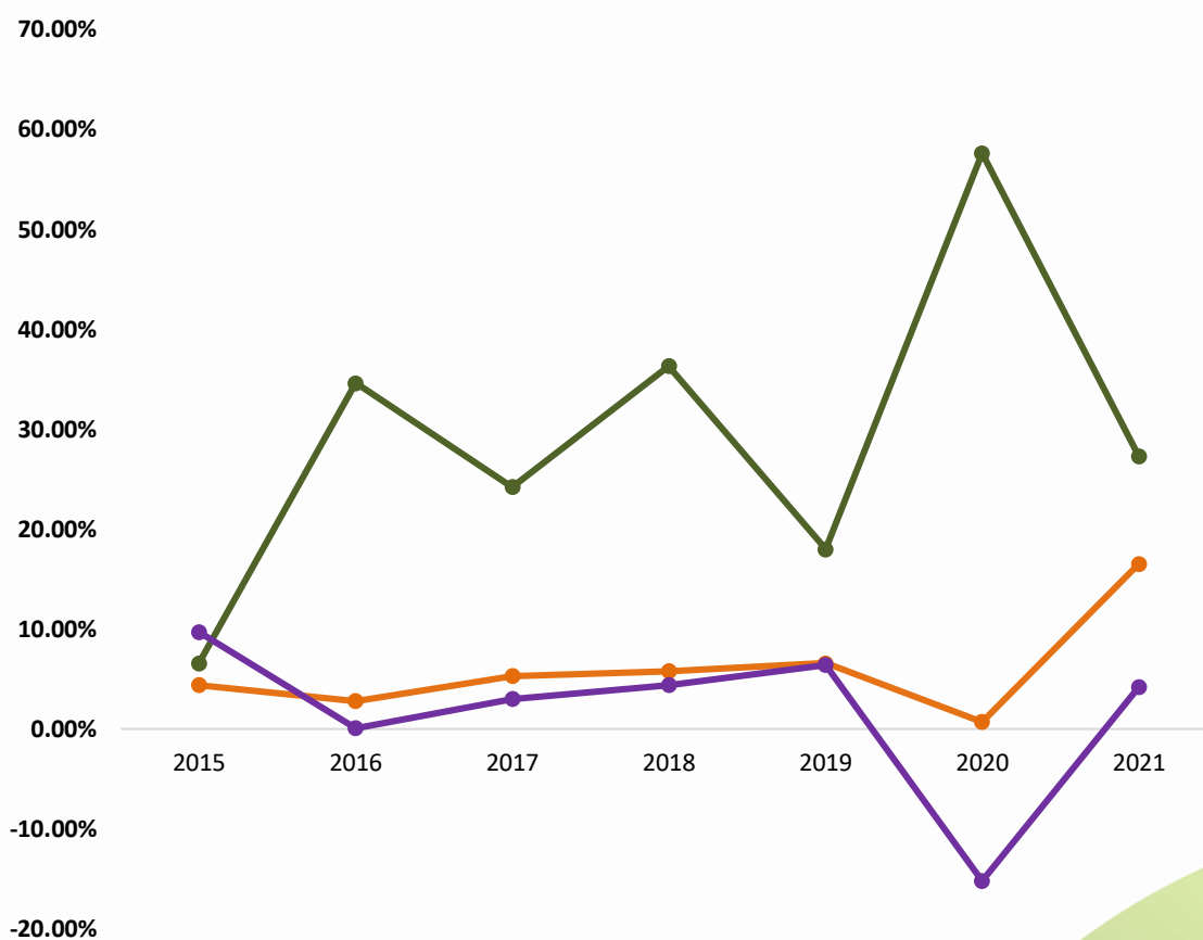
Рис. 1. Динамика прироста среднедушевых денежных доходов населения, оборота розничной торговли и объема Интернет-торговли, 2015-2021 гг., %